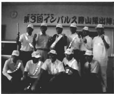
夏季巡回夜警事業

青年部は、今年も夏季巡回夜警事業を実施、8月の6日間述べ49名を動員して町内25箇所の巡回を行いました。この事業は夏休み期間中の青少年の非行や