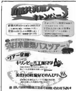
入るのは今がお得!

(コスモス&キリンビール工 場で地ビール/料理を堪能、温 泉でゆったりリフレッシュ!) このキャンペーンは、平成18 年度中に新規または満期で3口 以上ご加入頂いた方を1名様無 料ご招待する内容です。