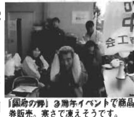
「国府の野」3周年イベントで商品券販売。寒さで凍えそうです。

豊津町商工会商品券事業は、加盟事業所の協力のもと、10月に発売以来好調に推移しております。12月1日に第2期分500万円分を発売中ですが、これも発売から2日間で360万円分が売れて今週中には完売の見込みです。第3期の発売は1月11日(木)350万円分。10%のプレミアは魅力あり。頑張りますよ。