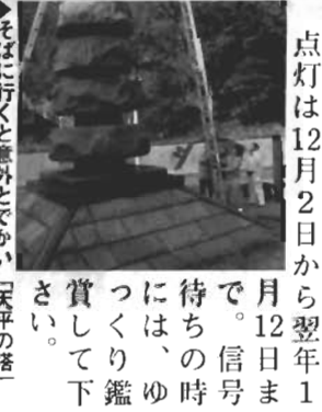
そばに行くこと意外とでかい「天平の塔」

12月3日(土)、強風と小雨の中、青年部員が「天平の塔」にイルミネーションを取り付けた。5年前に青年部地域貢献事業の一環として始めたこの事業も、今では年中行事となり、道行く人の目を楽しませ、季節の訪れを知らせる。